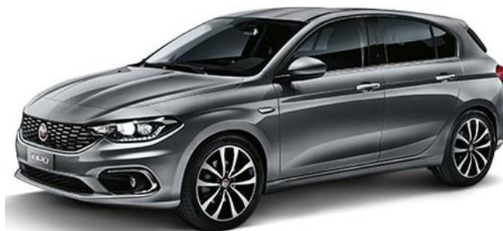
FOTO DEL VEICOLO