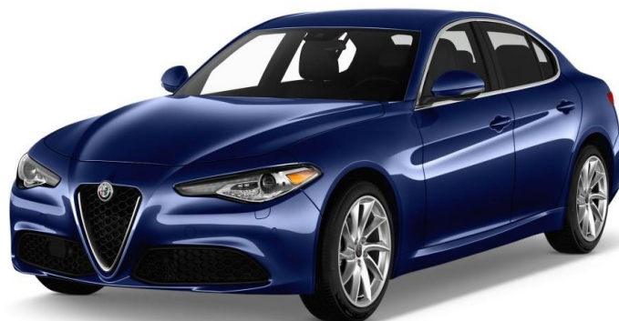
FOTO DEL VEICOLO